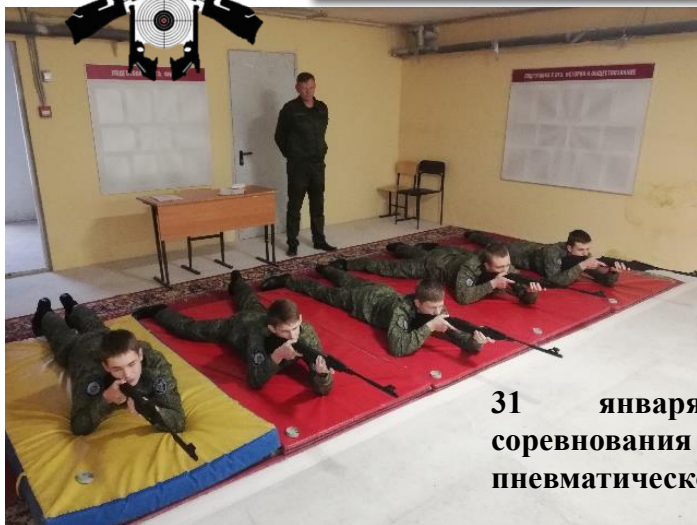
31 января состоялись соревнования по стрельбе из пневматической винтовки